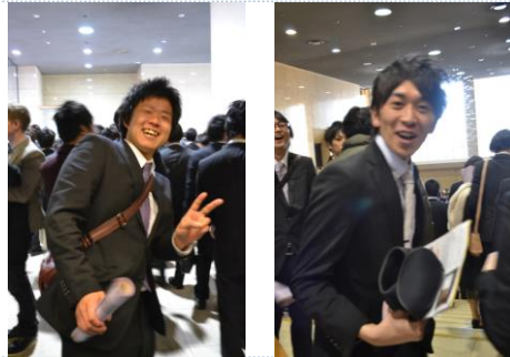
我所在研究室毕业的前辈