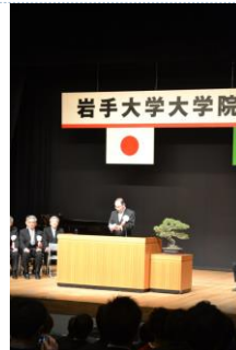
岩手大学校长致辞