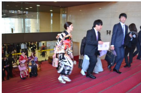
会馆大厅内盛装的毕业生们