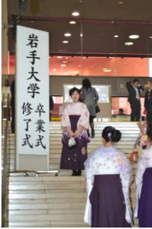
岩手大学毕业典礼

日本大学的毕业典礼被称之为“卒業式”，对于从大学院毕业的修士与博士来说则是“修了式”。每年的毕业典礼对于该年毕业的学生来讲，是一件类似于节假日的极为重要的庆典。岩大的毕业典礼一般于3月中旬在岩手县民会馆举行。