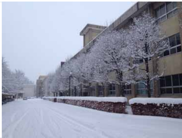
人文社会科学部1号馆前