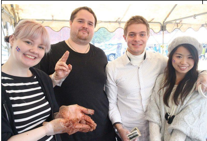
Íslensku skiptinemendurnir að búa til kókosbollur fyrir Japani á Iwate Háskólahátíðinni.