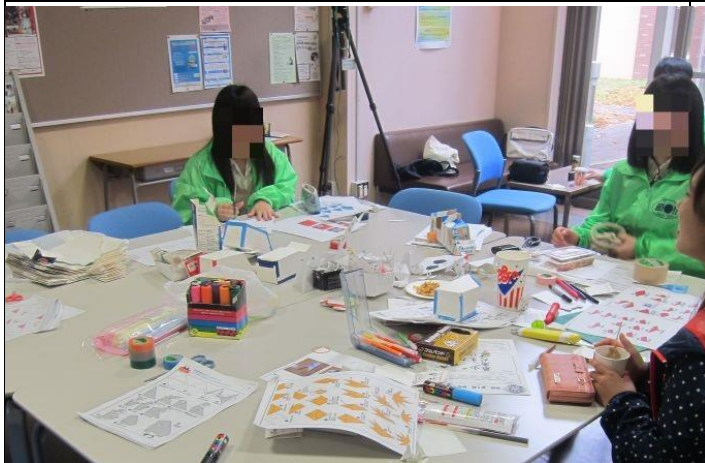
Japanskir nemendur úr klúbbi að kynna hið Japanska Origami fyrir fólki.